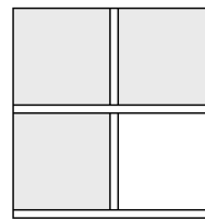
Versione con 3 ante e 1 cassettone DX