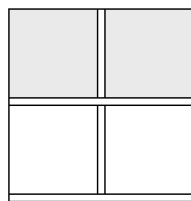
Versione con 2 ante e 2 cassettoni