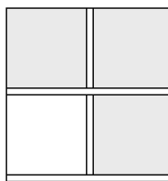
Versione con 3 ante e 1 cassettone SX