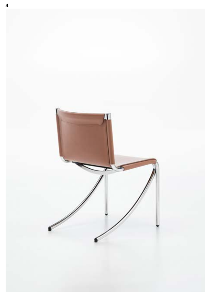
Sedie e divani

2-3 Pagina precedente: sedia con telaio in metallo disponibile nelle finiture verniciato opaco nichel nero o cromo. 2-3 Previous page: chair with metal frame available in matt black nickel or chrome painted finishes